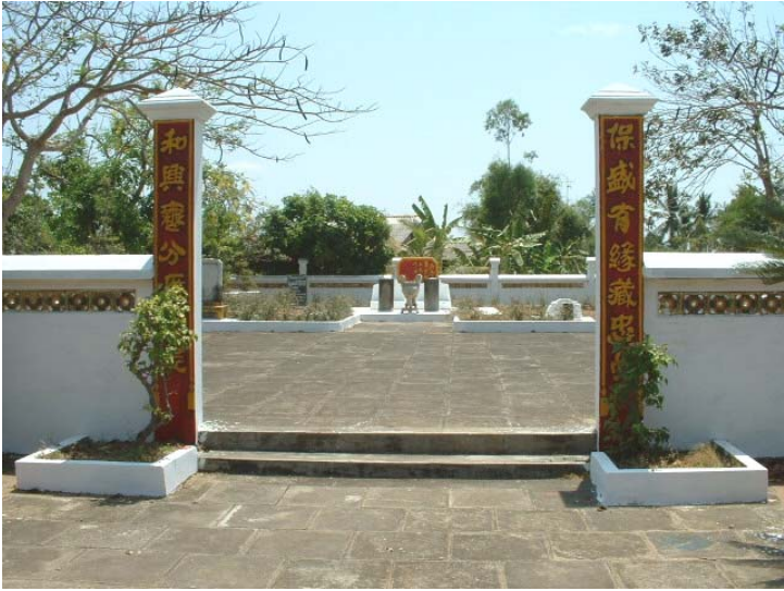
Cổng vào khu lăng mộ từ cổng chính đi thẳng vào