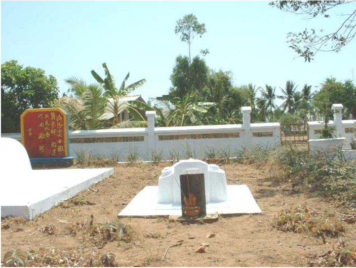
Mộ con gái của Võ Trường Toàn