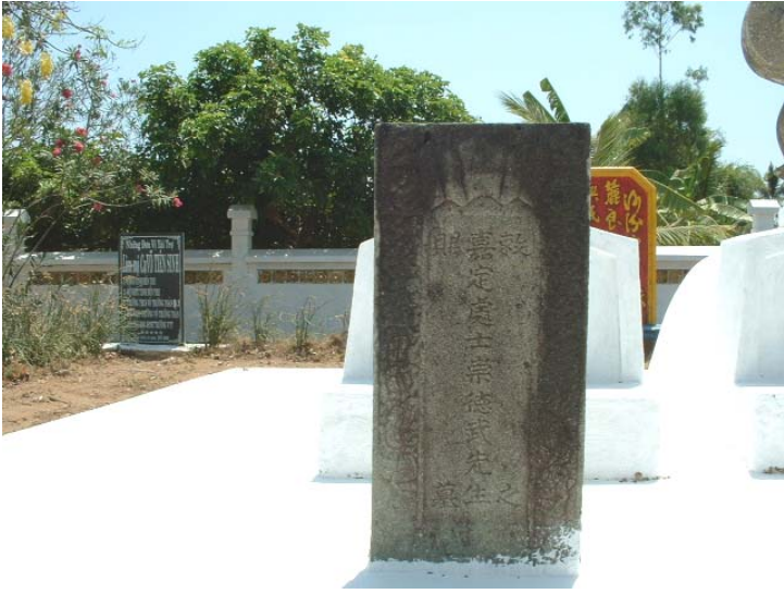
Mộ bia Võ Trường Toản