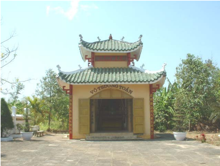
Đền thờ tọa lạc phía bên phải từ cổng chính đi vào