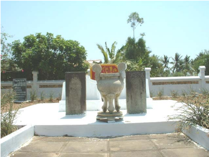
Mộ Võ Trường Toàn (bên trái) và Phu nhân (bên phải)