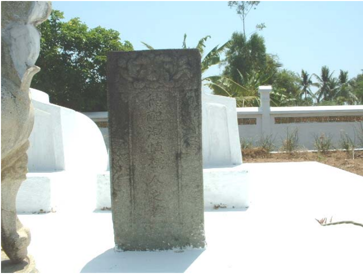
Mộ bia Võ Trường Toản phu nhân