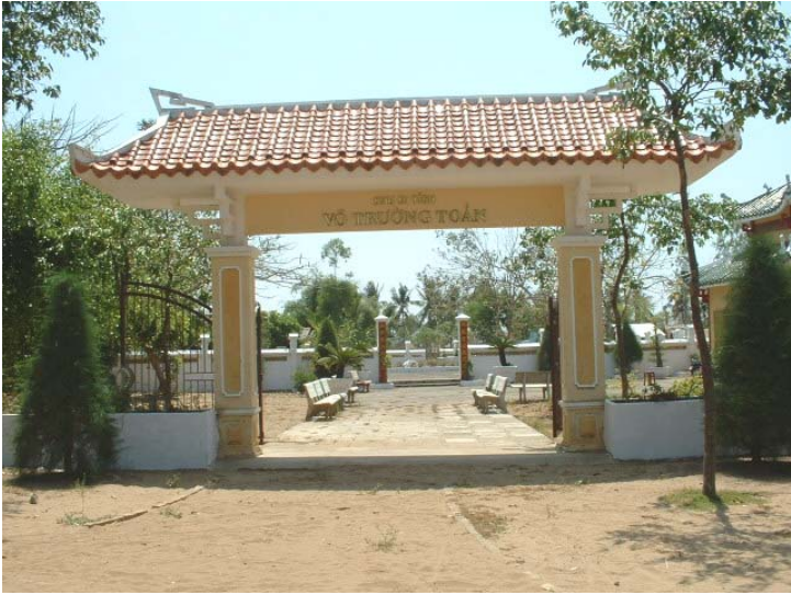
Cổng vào Khu Di Tích Võ Trường Toản